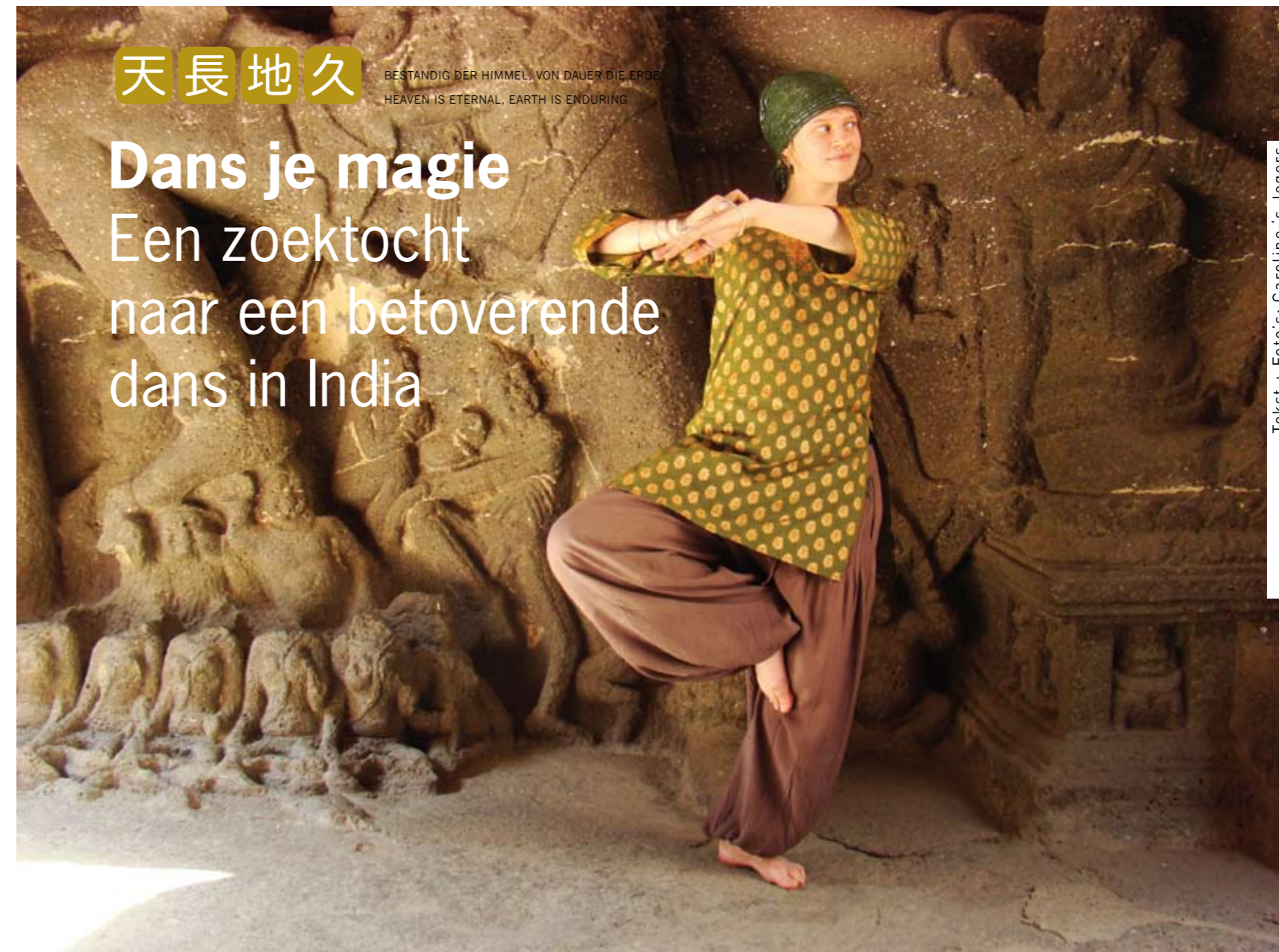
Tekst + Foto's: Caroline 's Jegers

Al sinds mensenheugenis maakt dans deel uit van de Indiase cultuur. Gedreven door mijn danspassie trok ik een aantal maanden door India en werd ik er bezielde door de betoverende krachten van de "slangendans".